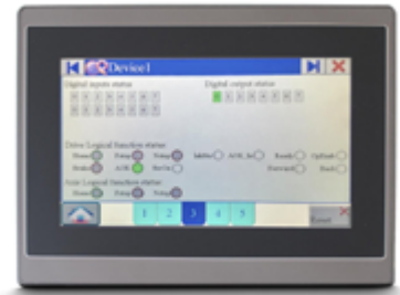
► PT2 HMI qui con una libreria CMZ configurata per flowpacks, packaging

Per quanto riguarda la tecnologia più propriamente MOTION , gli AZIONAMENTI costituiscono oltre ai controllori un altro fiore all'occhiello di CMZ da oltre 20 anni: in primis integrati nel motore tipicamente Brushless (ma anche SteplessTM), ma anche stand alone, sono oggi in continua ottimizzazione offrendo le taglie più richieste a prezzi sempre più competitivi riuscendo a conservare tutta l'expertise italiana di CMZ in termini di prestazioni quali precisione, interpolazione, accoppiamenti lineari e in camma.