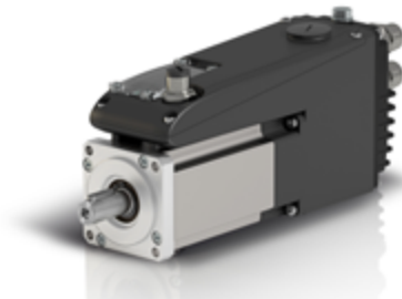
► IBD drive integrato brushless; elettronica sviluppata da CMZ